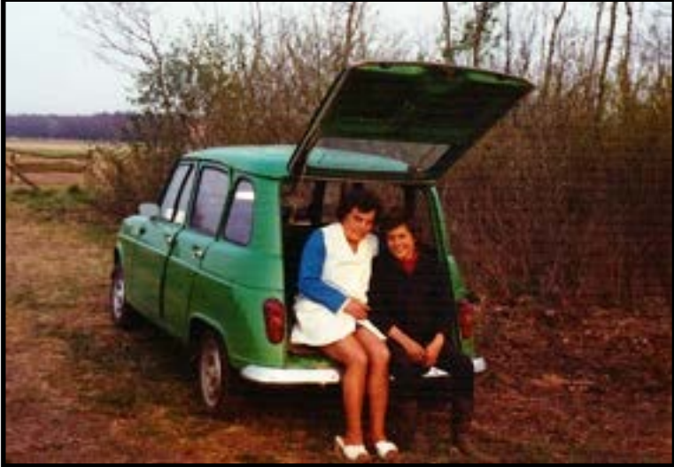
Oma en pap samen in de groene TL

eens all risk verzekerd, en het was een wonder dat opa er levend uit gekomen is verteld oma nog tot op de dag van vandaag!! Ze kan het zich nog zo goed herinneren, er was alleen nog maar een pakketje blik van over.