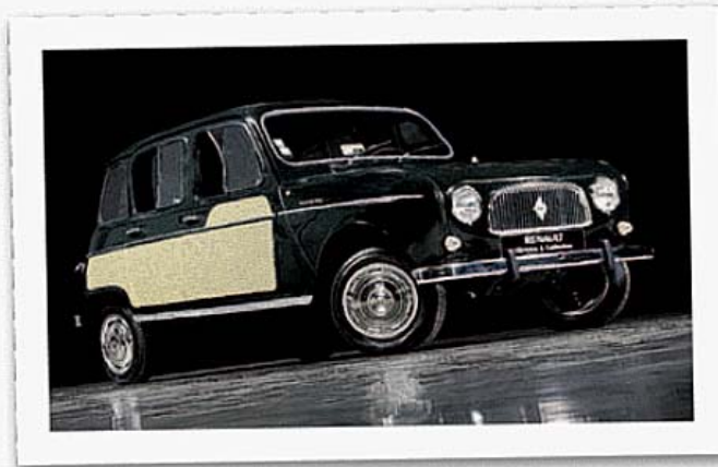
De Renault 4 is een icoon dat door liefhebbers wordt gekoesterd.

Na de Volkswagen Kever en T-Ford houdt de Renault nog steeds het record als derde meest geproduceerde auto van één modelgeneratie. Ruim 8 miljoen werden er van 1961 tot begin jaren negentig gemaakt, waarvan meer dan 2 miljoen van de verschillende bestelversies. Sterke punten van het model waren en zijn nog steeds zijn functionaliteit, de eenvoud van de constructie, de betrouwbare techniek en de mogelijkheid om het model overal ter wereld te kunnen repareren. In het compacte segment lanceerde Renault voor het eerst de handige vijfde deur, en waar de allereerste versies een achterbank hadden die met een vleugelmoer kon worden los-