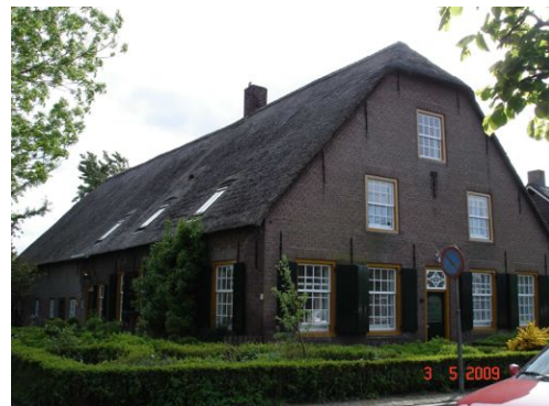
Naar: Thomashuis Burg. van der Schansstraat 80 4281 LK Andel Tel.: 0183-511699