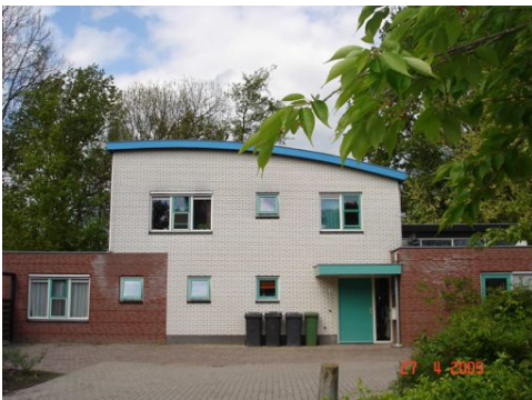
Van: Merwebolder Zeeldraaier 3 Sliedrecht